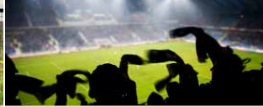
Ook meerderheid heeft vragen over Ghelamco (p. 3)