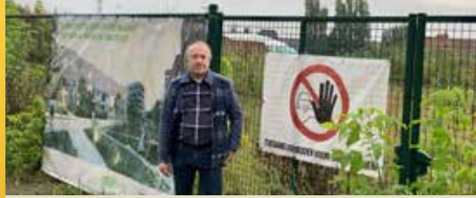
Vergunnig ecowijk Gentbrugge vernietigd (p. 2)